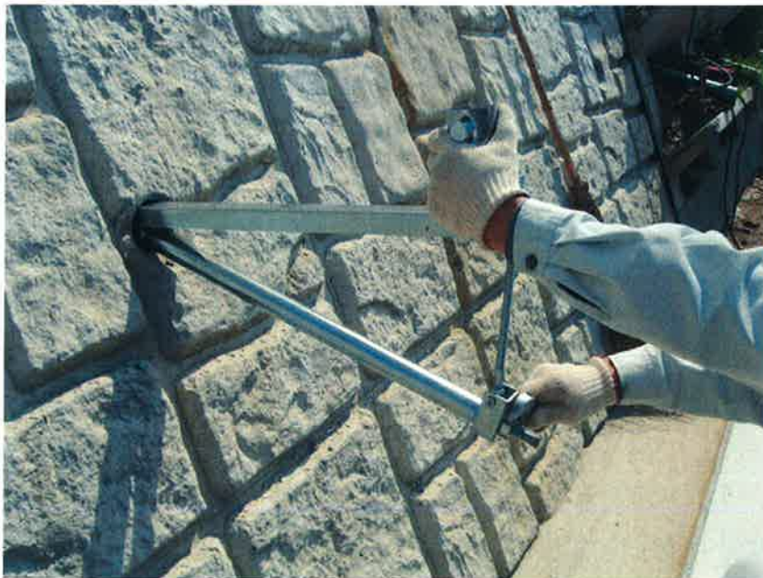
ゴムリングの部分まで水抜きパイプに差し込み、締付けナットで固定します。